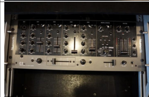
Mixer Numark c3 FX5 lub behringer 5 kanałów + case z półka na laptopa