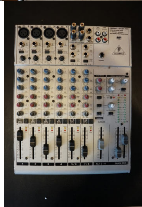
Mixer Behringer UB 1204-pro 6 Kanałów